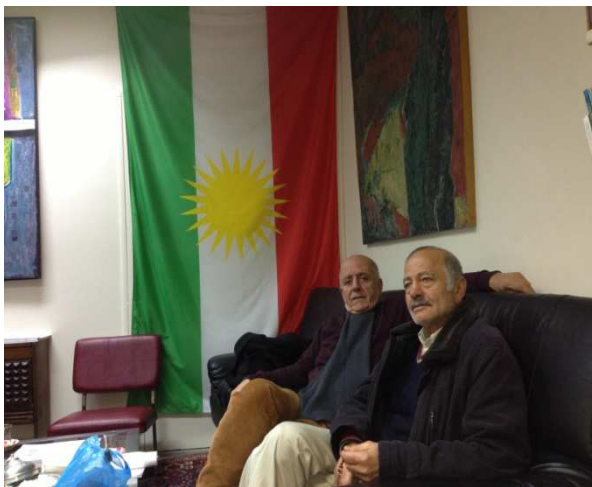
Li Înstîtûta Kurdî